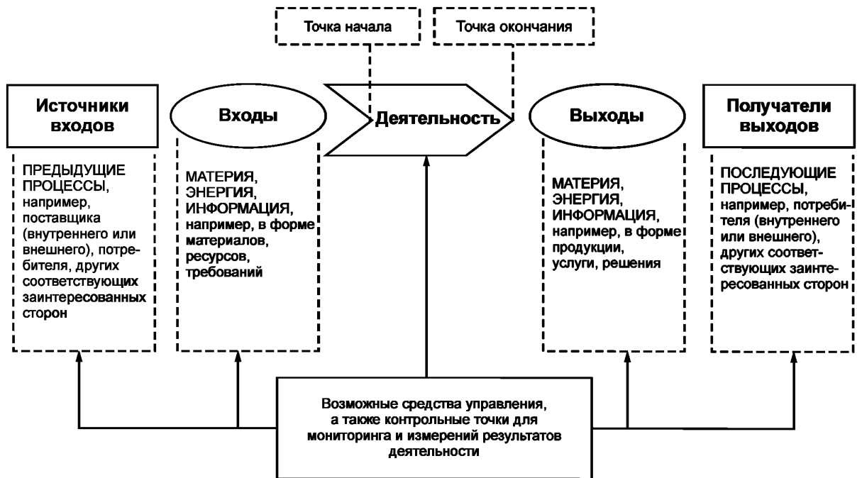
Рисунок 1 — Схематичное изображение элементов процесса

Рисунок 1 дает схематичное изображение любого процесса и иллюстрирует взаимосвязь элементов процесса. Контрольные точки мониторинга и измерения, необходимые для управления, являются специфическими для каждого процесса и будут варьироваться в зависимости от соответствующих рисков.